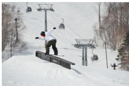
安全性を重視したジャンプやジブなど段階的スキルアップできるパーク