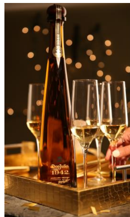
Ice Lounge by Don Julio 1942