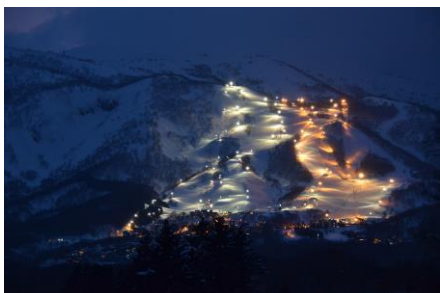
ヒラフナイター。趣の違う2色の照明は特別な時間を演出します。