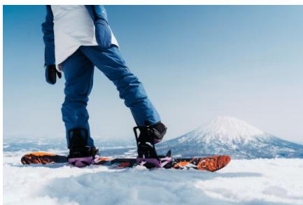
Burton Step On®を北海道最大級で導入