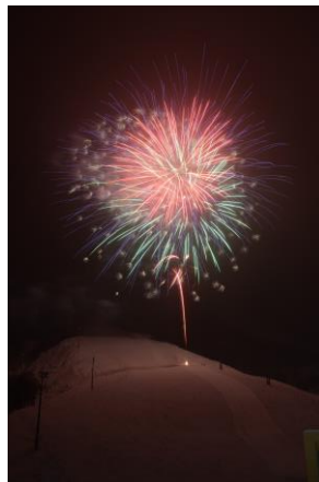
花火大会など、各種イベント実施予定