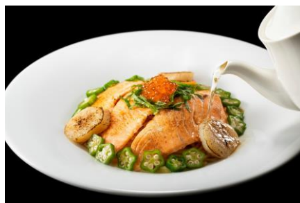
レストハウスエースヒルお薦めの「お出汁パスタ」