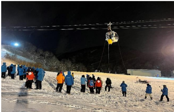
【冬季ゴンドラ救助訓練】