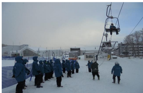
【冬季シーズン前救助訓練】