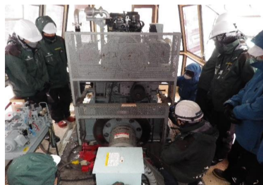
【予備原動機切替訓練】